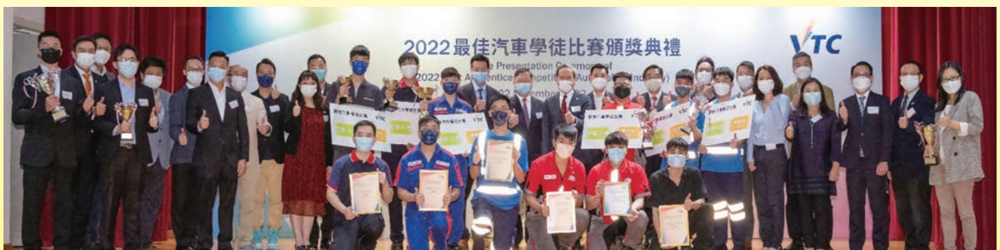
2022 最佳汽車學徒比賽得獎者與主辦單位大合照。