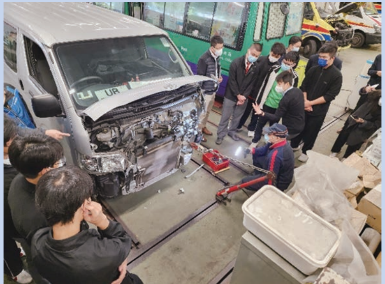
機電署人員示範維修底盤的技巧。