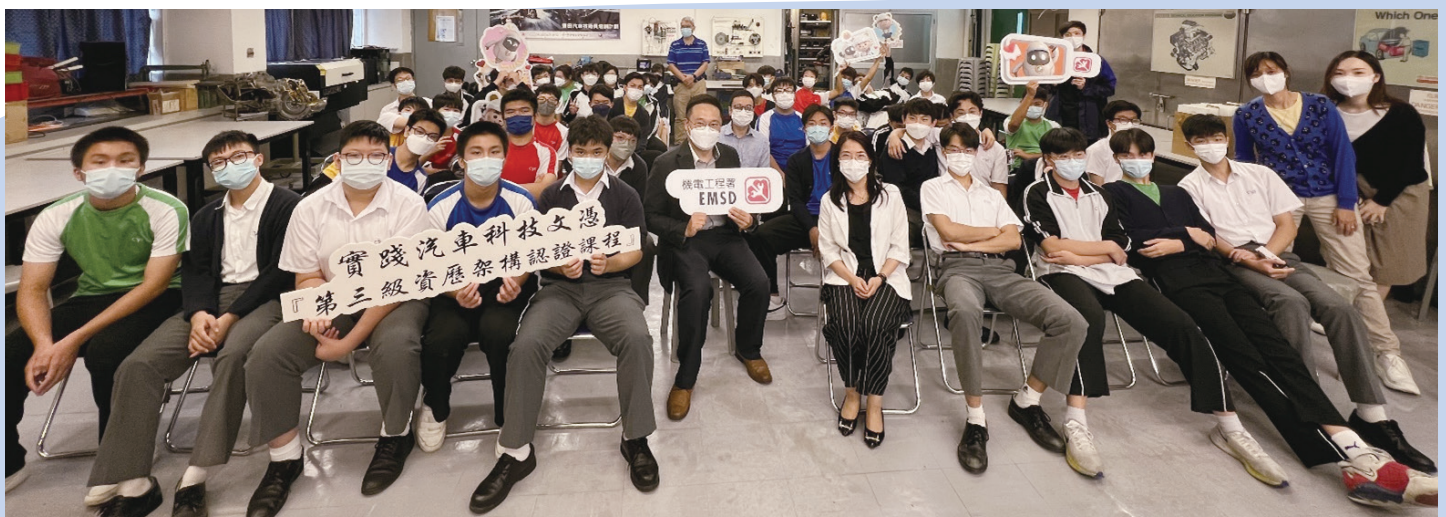
註冊組人員和資歷架構秘書處代表與同學大合照。