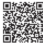
緊湊型熒光燈 (慳電膽)