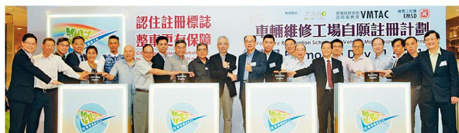
■運輸及房屋局常任秘書長（運輸）黎以德（左十二）和機電工程署署長陳帆（右十一）在油塘大本型主持「車輛維修工場自願註冊計劃」推廣日啟動儀式。

政府採取按部就班的方式，於2007年先推行「車輛維修技工自願註冊計劃」，以減輕對業界可能造成的影響。香港現時約有7,000名註冊技工。