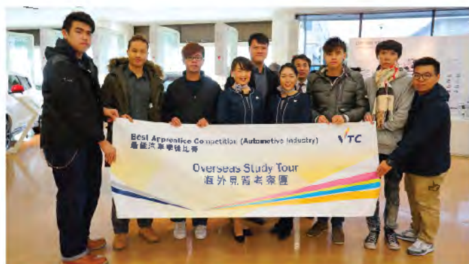
6位优胜学徒到日本参观日产车厂

每年的最佳汽车学徒比赛都获得汽车业界鼎力支持。今届「汽车机械工和汽车电工组」的4位优胜者与「车身修理工和汽车喷漆工组」的2位优胜者，获安排于11月23日至27日前往日本参观日产车厂和其他汽车展馆。他们回来后都表示，这次比赛和海外学习之旅不单对提升技术极有帮助，亦让他们扩阔视野，对在汽车维修行业的未来事业发展，信心更坚定。