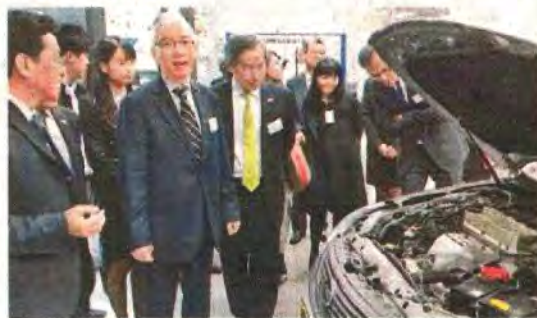
■職訓局與汽車維修管理協會推出汽車業「職」學創前路先導計劃。

八千名從業員，主要提供車輛銷售及售後服務，如系統檢查保養、故障診斷及維修、零部件更新等，希望透過拍攝宣傳片，提升行業形象以吸引更多年輕人入行，「以前一講維修汽車就覺得又熱又辛苦，怕父母都唔想仔女做車房仔，但其實依家維修汽車好多已經電腦化，從業員最主要係用電腦搵出部車有咩問題，維修方面亦有好多機器輔助，唔使再『搵車底』，而係升起成架車做維修」。