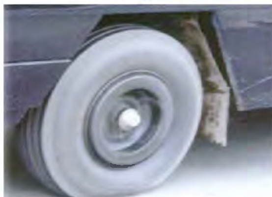
运行中的零气压轮胎