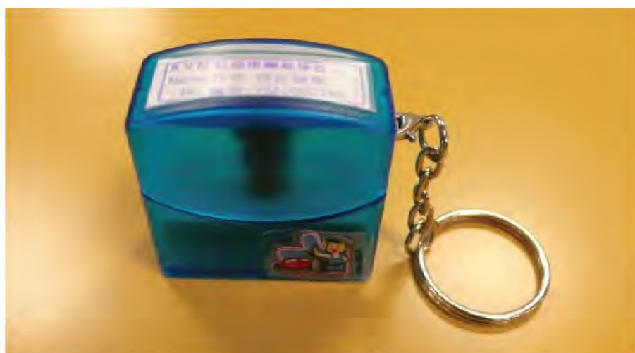
「注册车辆维修技工便携式专用印章」样本