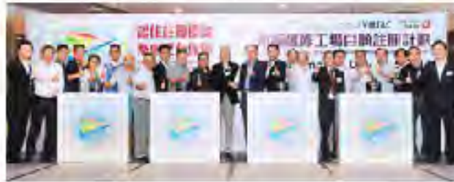
众嘉宾主持亮灯仪式后合照