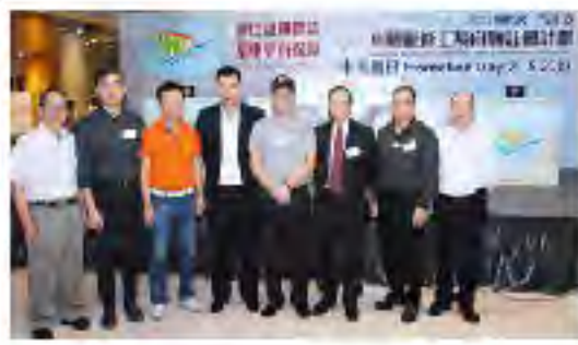
车辆维修技术咨询委员会委员合照