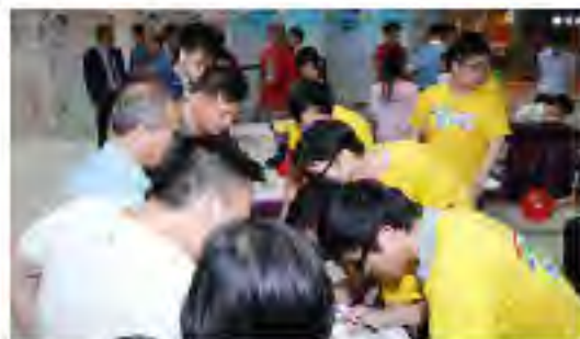
机电工程署人员为车辆维修技工登记 及介绍该计划的内容