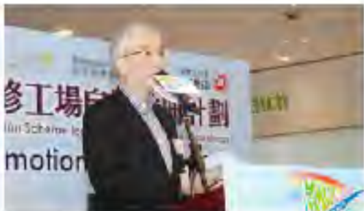
运输及房屋局常任秘书长（运输） 黎以德太平绅士致辞