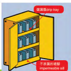
指定存放废电池和废润滑油等化学废物的地方