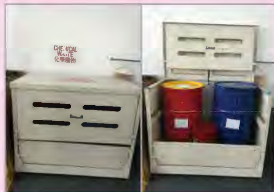
化学废物存放地方的例子

http://www.epd.gov.hk/epd/tc_chi/environmentinhk/waste/guide_ref/guide_cwc_sub3.html