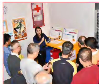
7月28日的参观活动花絮