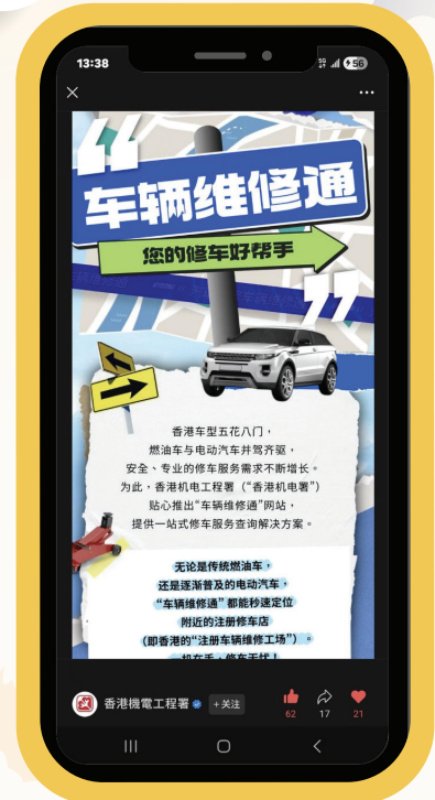
机电署透过微信官方帐号发布有关「车辆维修通」平台的帖文。