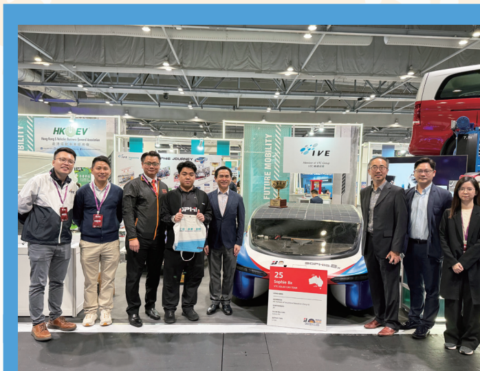
机电署代表与职业训练局代表(左图)和香港生产力促进局代表(右图)合照。