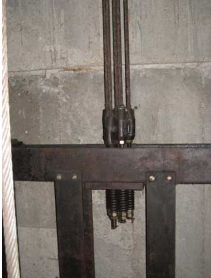
相片 1 - 5 條懸吊纜索仍故定在對重裝置上