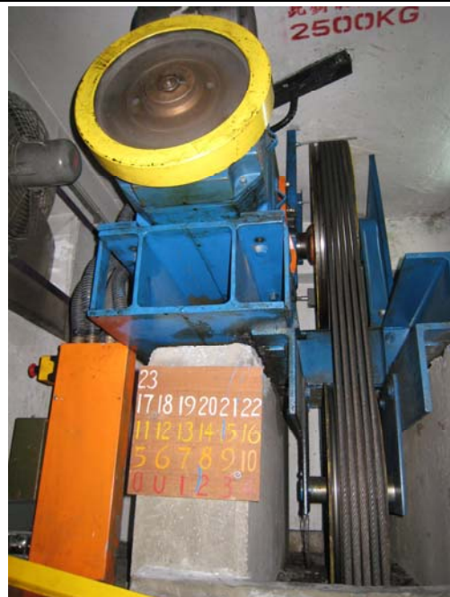
相片 4 - 2 號升降機機驅動沒有明顯損壞