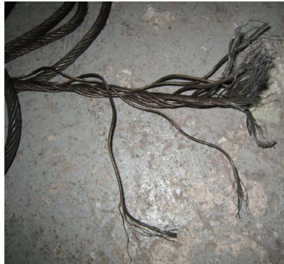
相片 2 - 斷裂的懸吊纜索