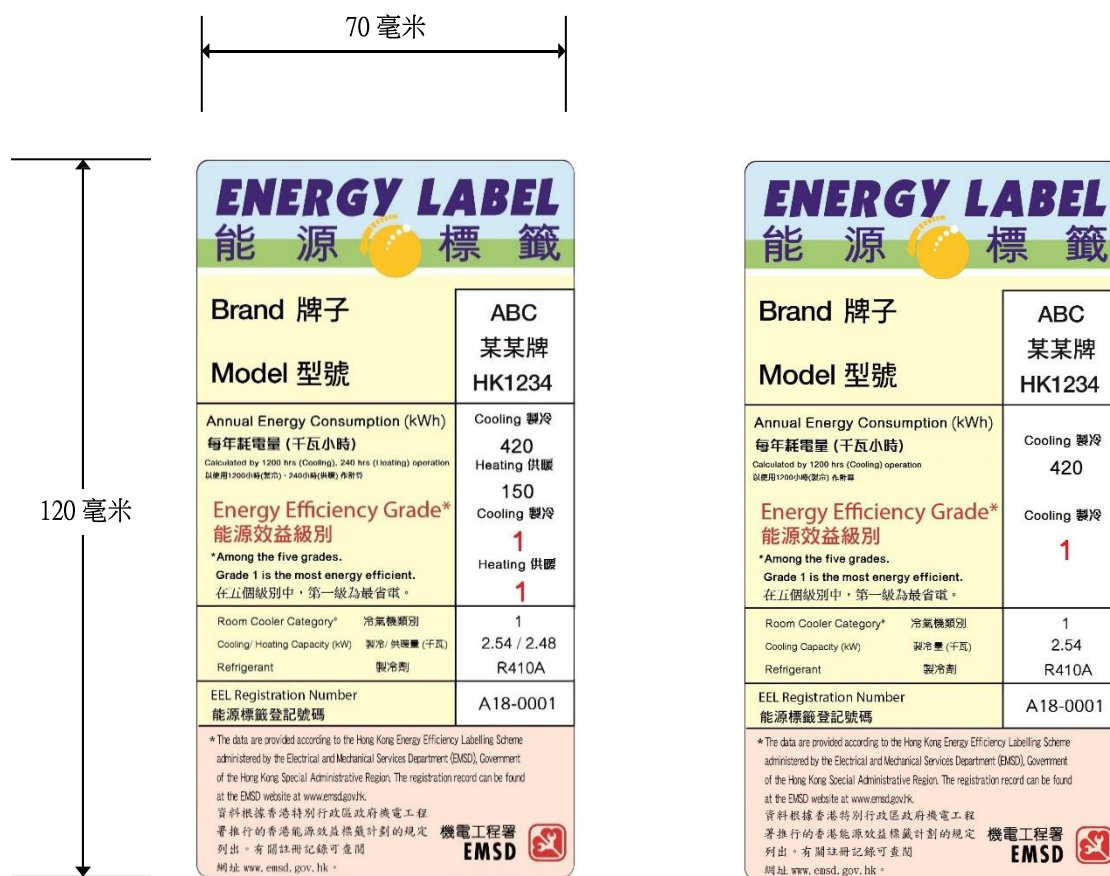
逆轉循環式空調機