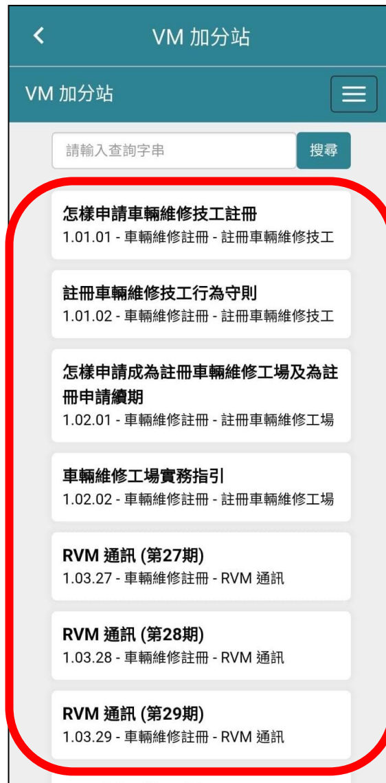
會顯示可報讀的課程