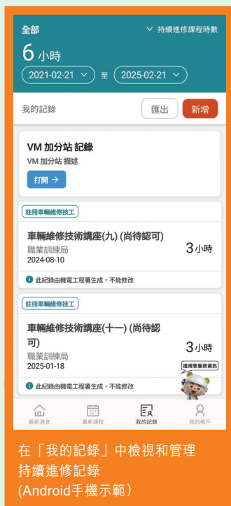
在「我的記錄」中檢視和管理持續進修記錄 (Android手機示範)

用戶可以在「我的記錄」中檢視和管理持續進修記錄，更可透過內部連結前往「VM加分站」隨時隨地學習車輛維修知識，或閱讀《RVM通訊》。