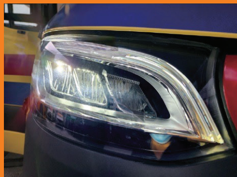
發光二極管照明設備。

以往《道路交通（快速公路）規例》(第374Q章)只容許符合若干規格的電動私家車、電單車和機動三輪車在快速公路行駛，其他種類的電動車則須向運輸署申請快速公路許可證。考慮到商用電動汽車科技的急速發展，運輸署修訂了第374Q章，並於2025年3月1日生效，准許額定功率不少於7 000瓦的電動的士、電動私家小巴、電動巴士（包括私家和公共巴士）、電動貨車（包括輕、中和重型貨車）和電動救援車輛，無需申領快速公路許可證，便可在快速公路上行駛。