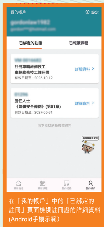
在「我的帳戶」中的「已綁定的註冊」頁面檢視註冊證的詳細資料 (Android手機示範)