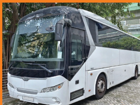
單層巴士的允許全高度增至4米。