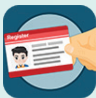
「機電行業通」流動應用程式標誌