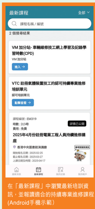
在「最新課程」中瀏覽最新培訓資訊，並報讀適合的持續專業進修課程 (Android手機示範)