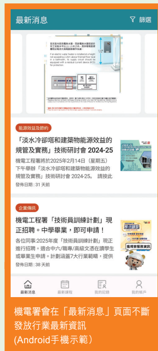
機電署會在「最新消息」頁面不斷發放行業最新資訊 (Android手機示範)

用戶可在「最新課程」中瀏覽最新培訓資訊，並報讀適合的持續專業進修課程，充實自己，與時並進。