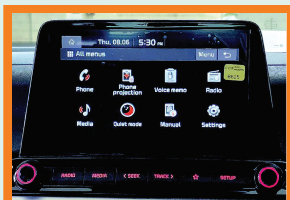
駕駛座前方的視象顯示器

運輸署希望車輛維修業界在維修車輛時，確保視象顯示器符合新要求；否則，視象顯示器必須遵照舊要求，只許向司機顯示上述四種資訊。