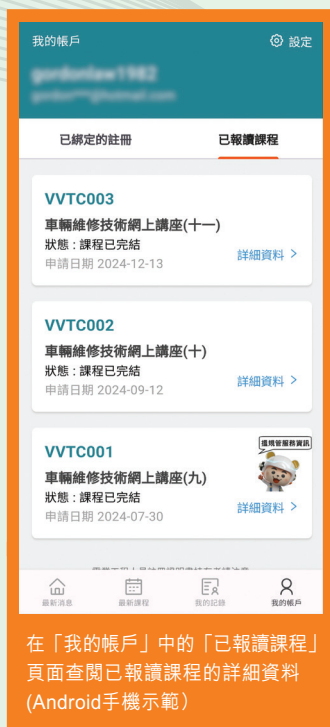
在「我的帳戶」中的「已報讀課程」頁面查閱已報讀課程的詳細資料 (Android手機示範)

在登記「機電行業通」流動應用程式帳戶後，用戶可以連結「智方便+」流動應用程式，以便日後利用「智方便+」登入「機電行業通」。註冊車輛維修技工在登入「機電行業通」流動應用程式後，在「我的帳戶」中的「已綁定的註冊」頁面可以檢視已綁定註冊證的詳細資料，亦可以在「已報讀課程」頁面檢視已報讀課程的詳細資料。