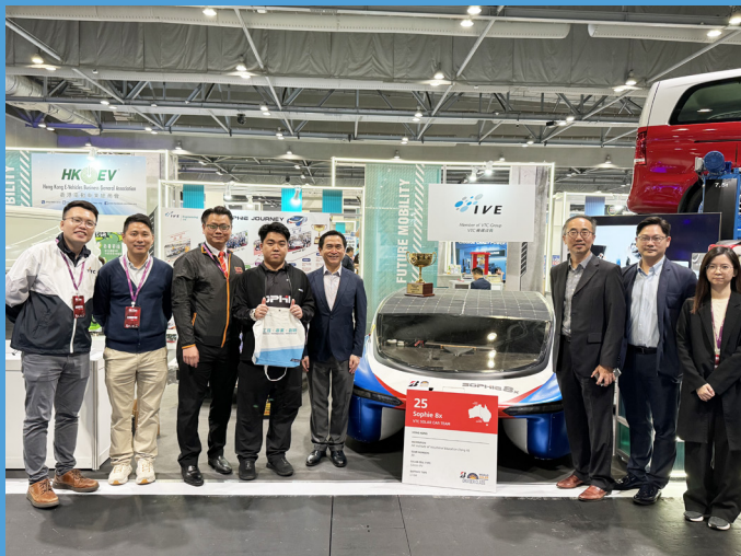
機電署代表與職業訓練局代表(左圖)和香港生產力促進局代表(右圖)合照。