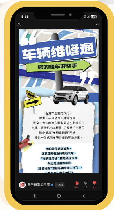
機電署透過官方微信官方帳號發布有關「車輛維修通」平台的帖文。