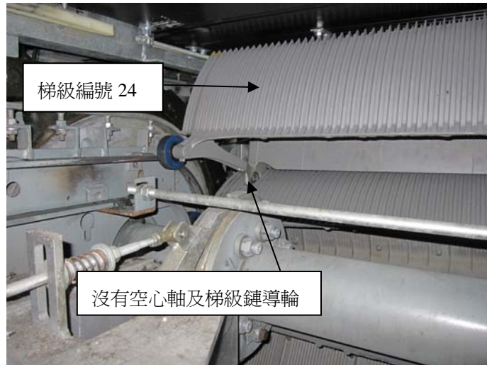
圖 3 - 左邊梯級連接桿沒有空心軸及梯級鏈輪連接