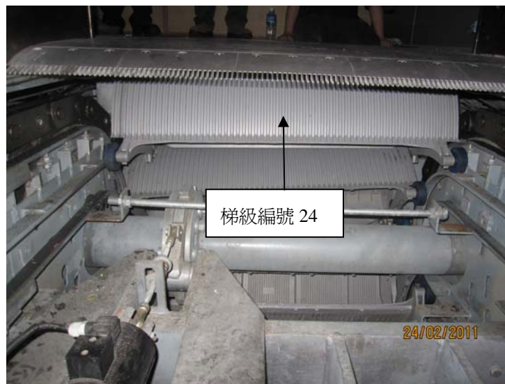
圖 2 - 第一級被卡着的梯級(梯級編號 24)於上層梳齒板下