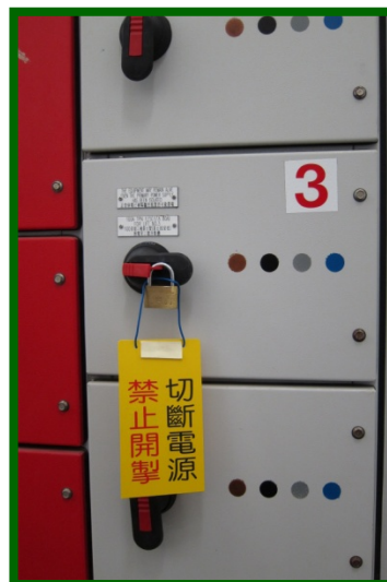
圖 9 (8.5.3c):