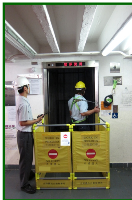
圖 1(8.2.1e): 提供升降機槽的安全進出口