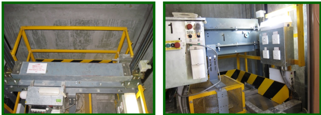
圖 12(9.1.8b): 升降機機廂頂必須提供安全圍欄及踢腳板