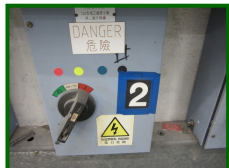
圖 10(8.8.4): 在電源開關的位置，貼上「電力危險」的警告標語