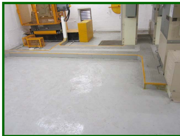
圖 5(8.5.1c): 行人通道要暢通無阻，而地面亦應防滑