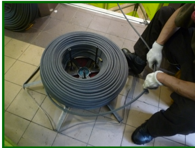
圖 15 (9.2.4): 最低樓層或地下樓層層站應有足夠的空間，並以圍欄圍着以作臨時儲存纜索之用及方便進出