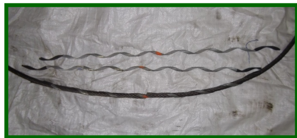
圖 16 (9.2.15): 纜索絞接

9.2.15 在使用“纜索絞接”（俗稱“豬腸”）時，應考慮全新纜索的重量及最高負載量，以便符合廠商之使用規定，亦須遵照廠商說明書的各項指引，包括有關重疊的規定。禁止重覆使用“纜索絞接”。