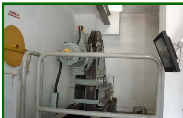
✘ 有待改善的作業模式