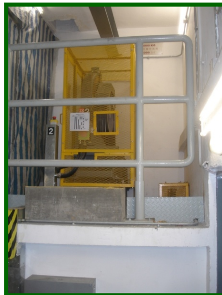
圖 6(8.5.2d): 在高處的工作平台應安裝適當護欄及踢腳板