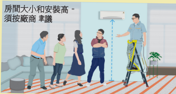
「安全使用輕度易燃雪種家用式冷氣機」